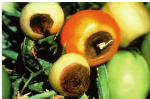
Figura 3. Deficiencia de calcio en frutos de tomate.