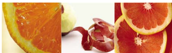
Figura 2. Fuentes de extracción de pectinas.

Existen diferentes técnicas para la extracción de pectina a partir de tejidos vegetales, en las cuales pueden utilizarse procedimientos físico-químicos, o enzimáticos (Zapata et al. , 2008). Con la finalidad de obtener un mayor rendimiento durante la extracción de sustancias pécticas, comúnmente se realizan pre-tratamientos al material vegetal para facilitar la extracción. Es imposible extraer pectina libre