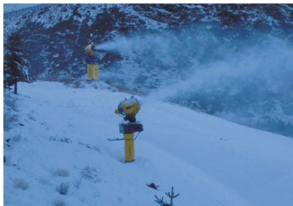
Figura 2: Nieve fabricada con (-\text{CH}_2\text{CH}[\text{CO}_2\text{Na}]-)_n . [ http://www.cienciaonline.com/2008/03/06/%C2%BFcomo-se-hace-la-nieve-artificial ].

La nieve real es difícil de manejar, así que la artificial resulta mejor. Una de las primeras mezclas famosas nació en 1930, con virutas de yeso blando y copos de maíz blanqueados. Posteriormente, se ha recurrido a la celulosa, almidón de papa o arroz, espuma o sulfato de magnesio, dependiendo del área a cubrir o el presupuesto disponible (Lutz, 2009) (Figura 2).