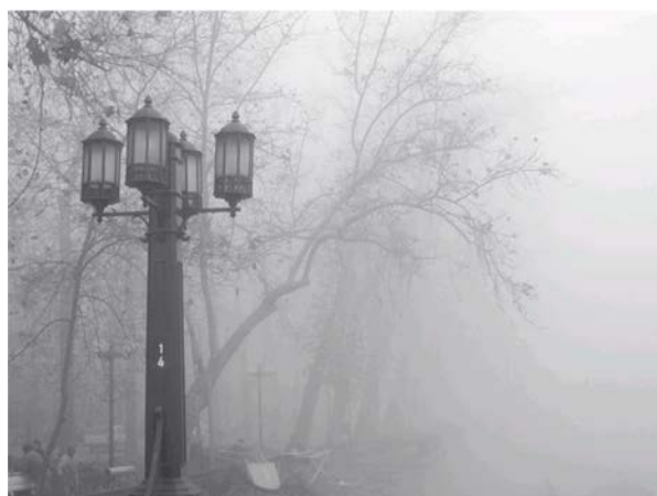
Figura 1. Niebla real. [ http://hablemosdemisterio.com/misterio/la-niebla-%C2%BFuna-puerta-de-entrada-a-lo-paranormal ].

en las cuales su fase líquida es revertida y vuelve a ser gaseoso. En el proceso, enfría el aire a una mayor velocidad que el \text{CO}_2 comprimido (porque la temperatura a la que se mantiene el estado líquido es mucho menor) condensando el aire a su alrededor rápidamente, manteniéndose cerca del suelo debido a su densidad. Debe tenerse entrenamiento apropiado y controlar la exposición al nitrógeno en esta técnica, porque las bajas temperaturas que se manejan pueden causar serios daños tisulares, además, el gas disminuye la concentración de oxígeno del aire por desplazamiento y puede causar desmayos o asfixia.