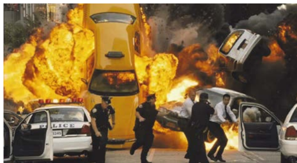
Figura 4: Explosión de autos en la película Avengers . [ http://varietalesdialecticos.blogspot.mx/2012/03/mitos-de-pelicula.html#!/2012/03/mitos-de-pelicula.html ].

Los explosivos generalmente tienen en común varios grupos ( \text{NO}_2^- ) cuyos oxígenos son estabilizados por resonancia. En el caso de la nitroglicerina, o TNT, un golpe es suficiente para desestabilizar dichas uniones y causar una explosión. Existen otros «explosivos» ligeramente más estables como es el caso de la nitrocelulosa, fácilmente sintetizable mediante la nitración (con \text{HNO}_3 y \text{H}_2\text{SO}_4 ) de papel o algodón puro como fuente de celulosa, que no explotan propiamente, pero se consumen por deflagración, creando el mismo efecto visual (Figura 4).