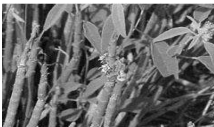
Candelilla ( Euphrobia antisiphylitica )