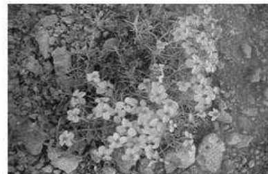
Zinia amarilla ( Zinnia grandiflora )