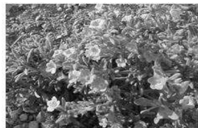
Hierba de la ventosidad ( Nama parvifolia )