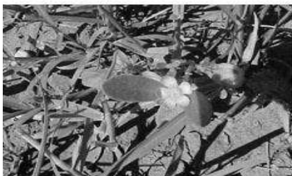
Verdolaga ( Portulaca oleracea )