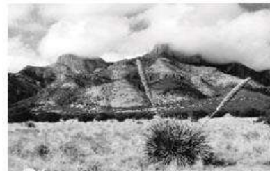
Sotol ( Dasylirion leyophyllum )