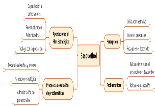
Figura 1. Resultados del análisis de entrevistas a especialistas.