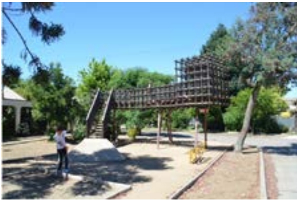
Figura 7. Obra de título, Nicolás Tapia, 2017. Elaboración Propia

Estos cuerpos que llegan a la universidad disciplinados, bajo su propio sistema de poder (colegio, familia) según la línea de Foucault (1977), en este ejercicio esta relación de poder cambia de foco. En este espacio los estudiantes funcionan como delimitadores de las acciones de otros (usuarios), por lo tanto cambian de disciplinados a disciplinantes, es de algún modo capaz de crear su propio discurso cultural en vez de ser el modelado por tales discursos culturales y poderes disciplinarios (Blackman, 2008).