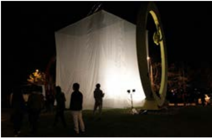
Figura 5. La Casa de Tela. 2012. Elaboración Propia.