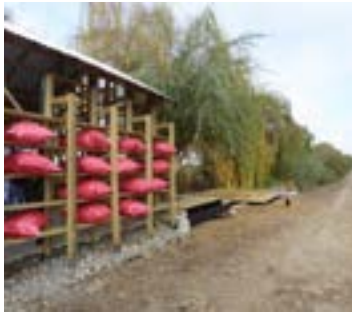
Figura 6. Obra de título, Rafael Recabal, 2017. Elaboración Propia.