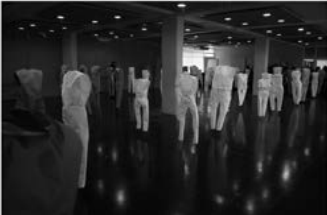
Figura 4. Cuerpos Vacíos. 2013. Elaboración Propia.