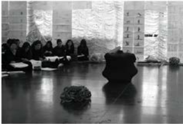
Figura 3. Taller del Cuerpo. 2012. Elaboración Propia.

86 A modo de dato anecdótico, este taller, como se mencionó al inicio, no es entendido por los estudiantes desde una mirada racional en el momento en que lo vivencian, sin embargo se pudiese decir que hay un par de indicadores que dan cuenta de que este ejercicio fue internalizado por ellos. Este ejercicio es recordado por los estudiantes como uno de los mas especiales en su formación, una vez egresados, y por otro lado, al ser preguntados años después, cual era su movimiento, muchos de ellos lo recuerdan sin ninguna dificultad. Es mas bien el cuerpo el que recuerda al estar en estado activo.