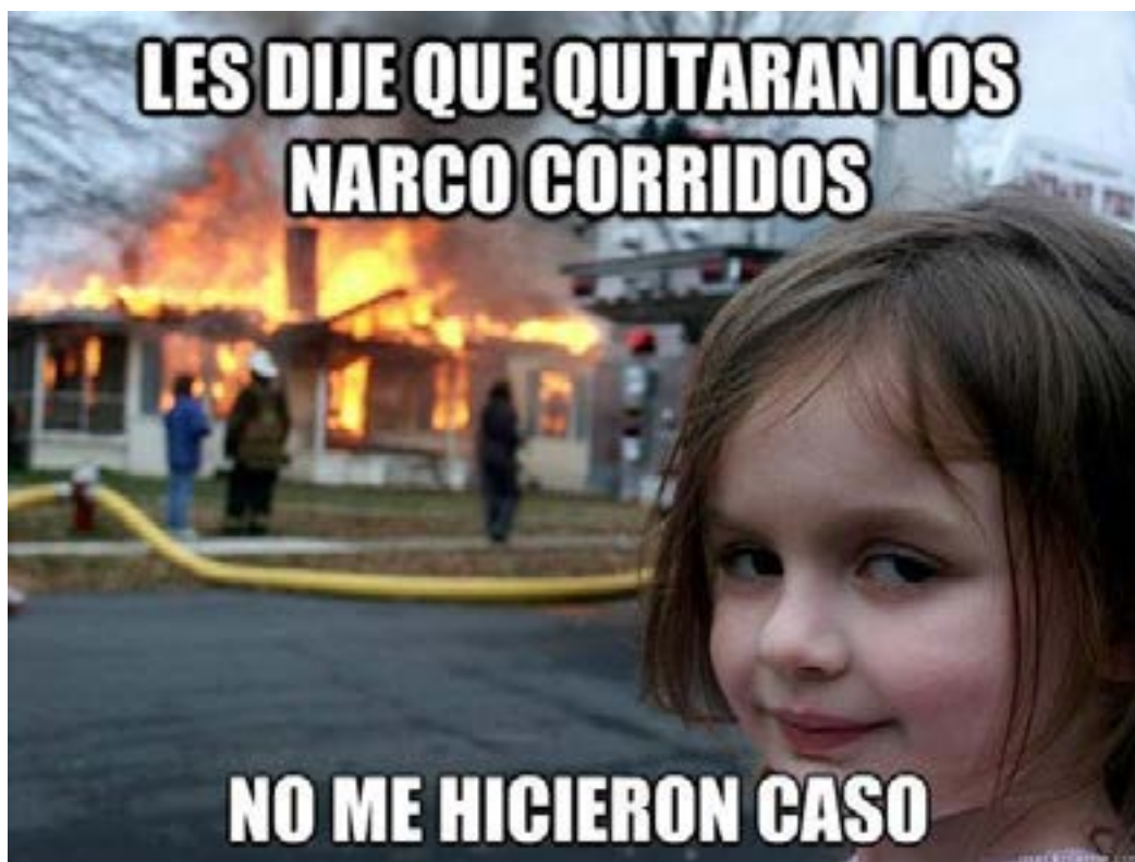
Imagen 6. Quick meme. La niña desastre.

La fotografía de la imagen 6, ha sido longeva, convirtiéndose en un referente visual, con cualidades retóricas asociadas a determinados aspectos creativos y humorísticos reproducidos en distintos contextos. Esta imagen fue denominada como: “La niña desastre” (BBC 1) 3 fue retomada por usuarios de la red y transformada con el objeto de incluir elementos retóricos para darle una función humorística.