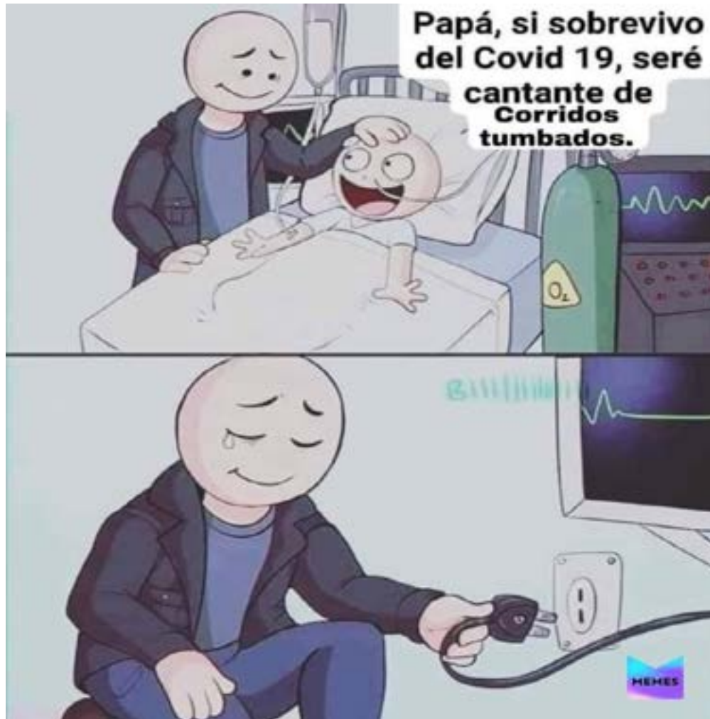
Imagen 1. Corridos memes.

parte connotativa, se centra en una relación familiar, padre-hijo, donde el hijo se encuentra postrado en cama, mostrando un elemento emotivo entre los dos personajes (Eco 69). La relación entre lo verbal y lo visual, nos sitúa en un punto, donde la parte verbal cumple la función de relevo , donde hay complementariedad entre lo icónico y lo verbal para presentar el mensaje. Esta función es menos frecuente que la de anclaje, se puede encontrar en el humor gráfico y los cómics; en estos casos, la palabra y la imagen se complementan y proporcionan el sentido al mensaje, de manera que: “las palabras son fragmentos de un sintagma más general, con la misma categoría que las imágenes y la unidad del mensaje tiene lugar a un nivel superior: el de la historia, la anécdota, la diégesis” (Barthes 37).