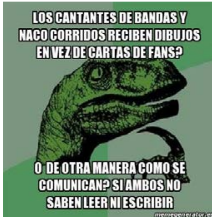
Imagen 5.

labios del mismo color. Esta adaptación busca proyectar una idea concreta, recurriendo al color negro como elemento distintivo y referencial de los “metaleros”. Estos elementos estéticos de sustitución, tanto de forma, como color, reemplazan de forma parcial, los componentes originales de las figuras, con el propósito de remarcar una idealización de belleza sobre un grupo y, a la vez, reiterar el prejuicio, vinculado a determinados géneros musicales como la banda o los narcocorridos.