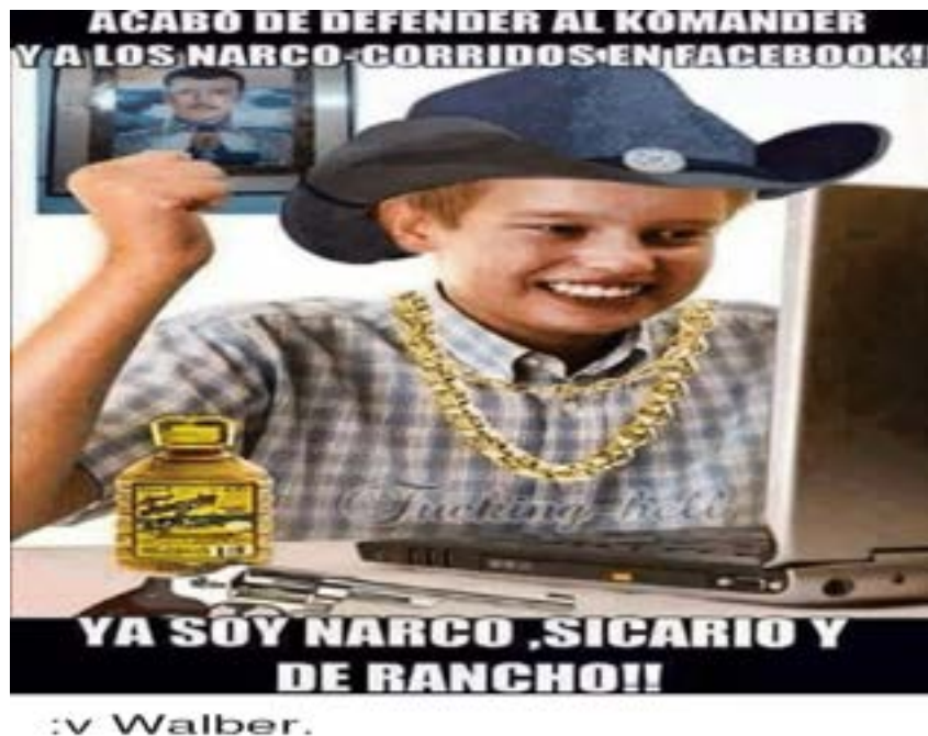
Imagen 7. MEME.

A partir de los conocimientos existentes sobre los objetos, se pueden reconocer referencias culturales que implican asignaciones que vinculan los tipos cognitivos y son la base para las interpretaciones (Eco 193). Esas asignaciones remiten a propiedades que pueden ser reconocidas por los receptores, pues en el caso de los narcocorridos existen referencias culturales que remiten a identificar los componentes icónicos que se encuentran en los memes.