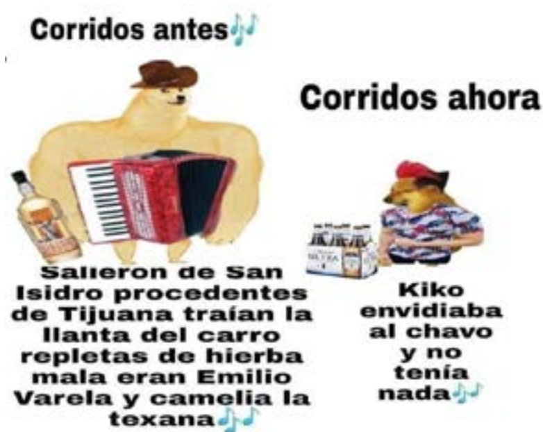
Imagen 2. Facebook, Ahorita no Joven.

De esta manera, se acude a la exageración y se pone de manifiesto el oprobio sobre los corridos de narcotráfico denominados como tumbados. El conocimiento socialmente compartido, implica abstracciones, definidas por objetivos, relaciones e identidades grupales, asociadas a normas y valores, capaces de posicionar a los grupos de cierta forma frente a un hecho y definirlo como bueno o malo, correcto o incorrecto; también pueden utilizar estereotipos o prejuicios de formas generales para expresar opiniones sobre el corrido o géneros derivados donde se estigmatiza y se imponen bases comunes compartidas por determinados grupos (Van Dijk 287).