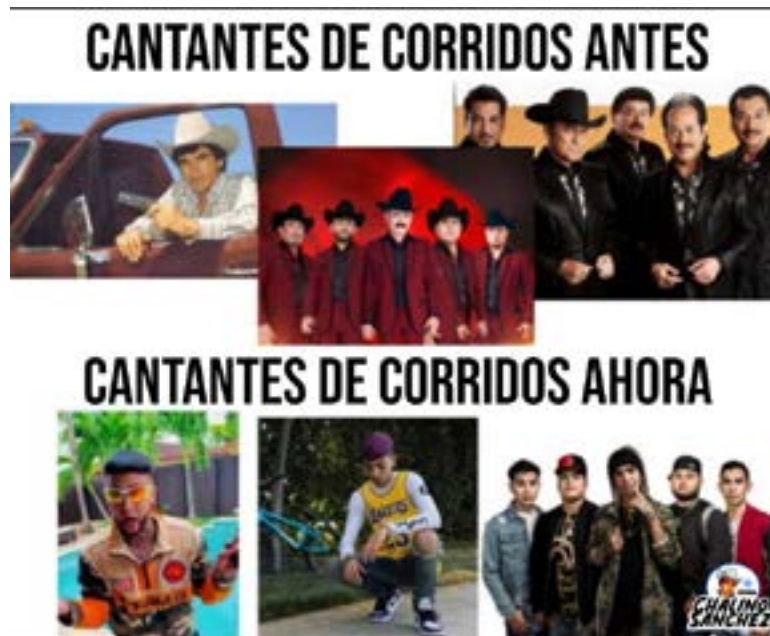
Imagen 3. Facebook, Chalino Sánchez, Extraído www.facebook.com/ElReyDelosCorridos

receptor a las variantes del interpretante. Podemos comprender que el productor del meme recurre a la cognición como componente de la interpretación de la imagen, pues se hace necesario el conocimiento de ciertos elementos verbales y visuales relacionados al significado de la producción (Eco 147).