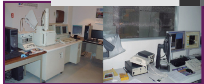
Figura 1 y 2. Los microscopios y equipo utilizado MEB Y MET respectivamente. JEOL-5800-LV y JEM-2200FS.

Facultad de Ingeniería, Universidad Autónoma de Chihuahua, FINGUACH Año 4, Núm. 13, septiembre - noviembre 2017