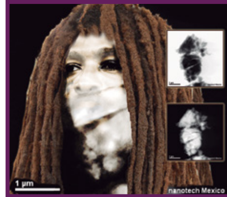
Figura 3. Fractal and Electrochemical Reaction of Lanthanum Oxide