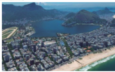
Fotografía 1. Laguna Rodrigo de Freitas, Brasil

En esta competencia la salida se da a las embarcaciones colocadas en línea y por mucho es la modalidad más practicada en México. Para las olimpiadas Brasil 2016, esta competencia se llevará a cabo en La Laguna Rodrigo de Freitas (conocida como lagoa en portugués) se ubica en el corazón de la ciudad, rodeada por montañas, la Floresta de la Tijuca y la estatua del Cristo Redentor, arriba del cerro del Corcovado (Fotografía 1). La Laguna queda a apenas diez minutos de las playas de Ipanema y Copacabana.