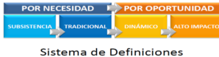
Imagen 3. Tipos de emprendimiento