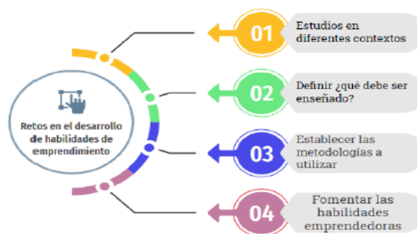
Imagen 4. Retos presentados en el desarrollo de habilidades de emprendimiento

Por su parte Portuguez Castro, (2020) destaca el rol que debe cumplir la educación formal para la creación de nuevo emprendedores para la economía del siglo XXI ayudando a fortalecer las habilidades requeridas y presenta los retos que todavía necesitan ser explorados a fin de que este aporte sea mayor. (Imagen 4)