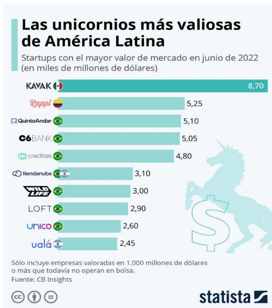
Imagen 1. Empresas unicornios

La imagen 1, muestra como KAVAK está valuada en 8,700 millones de dólares siendo la mejor en el área iniciando operaciones en octubre de 2016 y recibió su primer fondo de inversión de 3 millones de dólares, el más grande en su momento para una etapa catalogada como semilla (Hernández Armenta, 2021)